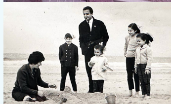
1963-1966 : à cheval entre l'hôpital de Saint-Venant près des plages de Béthune et la rue Ordener à Paris.