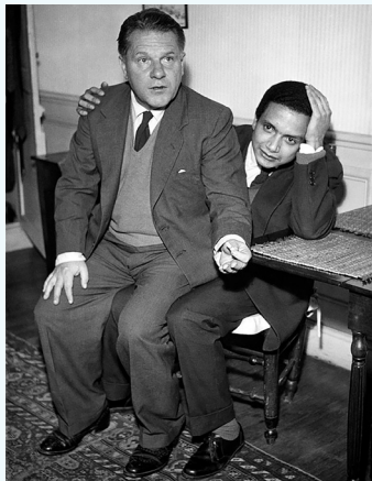
1962 : Jean Fanchette avec l'écrivain Lawrence Durrell lors d'une soirée de la revue Two Cities.