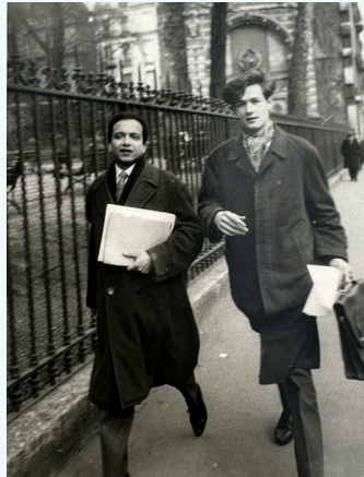
1963 : boulevard Saint-Germain à Paris avec le poète Claude Royet-Journaud.